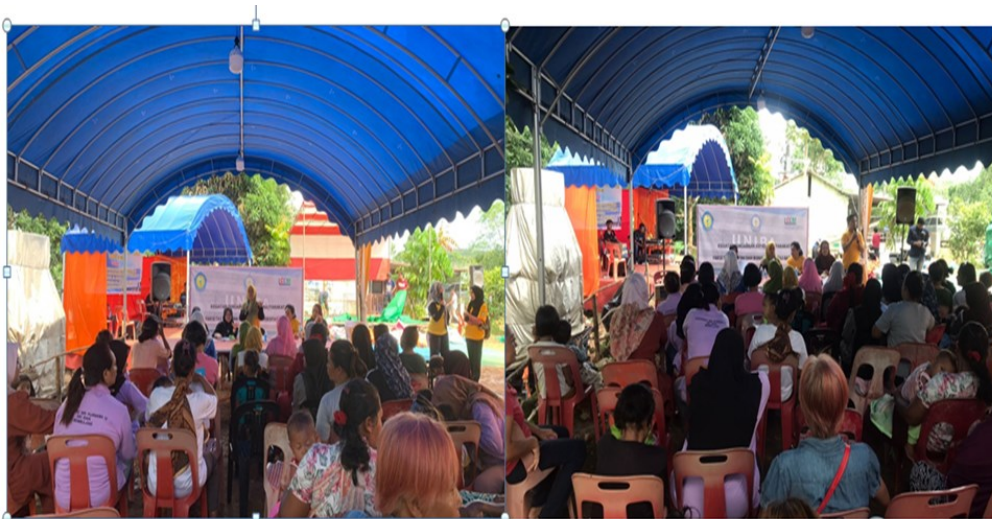
Gambar 3. Suasana Sosialisasi Pentingnya PIRT

Kegiatan PKM ini dilaksanakan dan berjalan dengan lancar dan aman bersama dosen dan mahasiswa Universitas Batam. Peserta yang hadir merupakan ibu-ibu PKK dan pelaku usaha mikro Desa Sungai Raya. Kegiatan dilaksanakan pada tanggal 24 Juni 2023 Tim PKM melaksanakan kegiatan sesuai dengan rencana yang sudah ditetapkan.