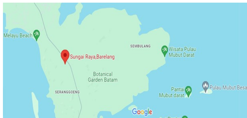
Gambar 1. Peta Lokasi Kegiatan

Desa Sungai Raya berada di Kelurahan Sembulang masuk dalam Kecamatan Galang Kota Batam Provinsi Kepulauan Riau. Kecamatan Galang terdiri dari 32 RW dan 83 RT dengan masyarakatnya yang terdiri dari berbagai suku bangsa meliputi Melayu, Jawa, Flores, Batak, Buton, Banjar dan lainnya. Masyarakat pada Desa Sungai Raya memiliki beragam usaha atau bisnis makanan mulai dari usaha kripik pisang, kripik bawang, bolu dan cake ulang tahun, namun belum memiliki sertifikat PIRT. Berdasarkan hasil survey awal, pengetahuan masyarakat atas perijinan usaha rumah tangga masih sangat minim sekali.