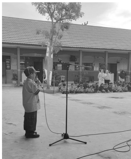
Gambar 4. Penampilan salah satu siswa saat acara minat bakat di hari Sabtu.