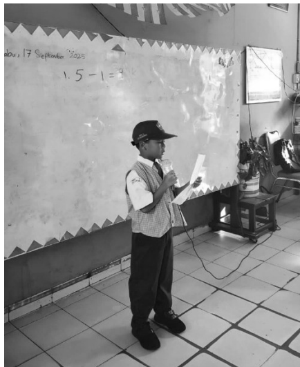
Gambar 3. Kegiatan latihan da'i cilik di kelas di depan teman-teman.