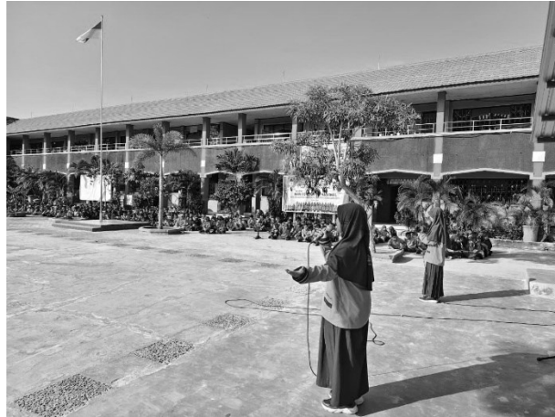
Gambar 5. Penampilan dua orang siswa saat acara minat bakat di hari Sabtu.