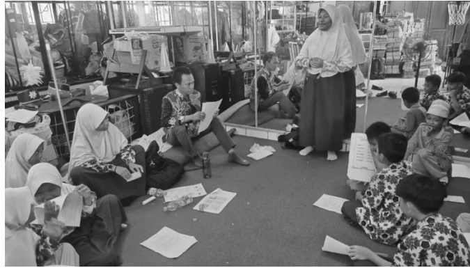
Gambar 2. Kegiatan latihan mingguan da'i cilik.