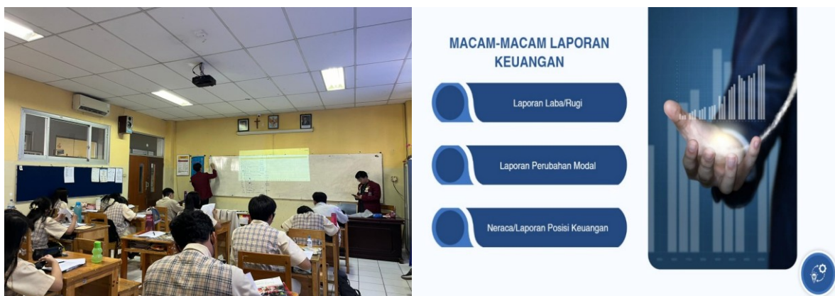
Gambar 2. Suasana mengajar di kelas dan Power point materi

Sebagai bentuk evaluasi, di akhir pertemuan diadakan penilaian harian untuk mengukur tingkat pemahaman siswa terhadap materi yang telah disampaikan. Penilaian dilakukan menggunakan media tulis, di mana para siswa diberikan neraca saldo setelah penyesuaian dan diminta untuk menyusun laporan keuangan lengkap, mulai dari laporan laba rugi, laporan perubahan ekuitas, hingga laporan posisi keuangan (neraca). Berikut disajikan hasil dokumentasi kegiatan beserta contoh soal yang diberikan kepada para peserta, seperti tampak pada Gambar 2 dan Tabel 1.