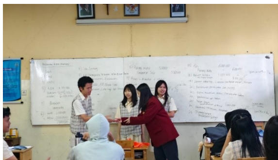
Gambar 6. Pemberian reward kepada 3 siswa terbaik dalam Penilaian Harian Kertas Kerja

Gambar 5 menunjukkan hasil nilai penilaian harian kertas kerja siswa kelas 12-2 menunjukkan bahwa secara umum, dengan indikator nilai 50 sebagai batas minimum nilai, terdapat 58,3% siswa telah memahami pelajaran terkait kertas kerja, dengan nilai diatas 50. Namun, terdapat banyak siswa juga yang masih kurang paham tentang pembelajaran mengenai kertas kerja, dengan nilai yang dibawah nilai minimum. Sehingga, remedial bagi siswa yang tidak lulus nilai minimum, yaitu 75, dilaksanakan pada pertemuan selanjutnya. Berdasarkan capaian kegiatan pembelajaran yang telah terlaksana dengan baik pada kelas 12-2 SMA Providentia, yang terlihat melalui hasil penilaian harian, dapat disimpulkan bahwa program ini memberikan dampak positif dalam meningkatkan pemahaman siswa. Faktor keberhasilan utama dari kegiatan PKM ini meliputi dukungan aktif dari pihak sekolah, antusiasme sebagian besar siswa dalam pelaksanaan pembelajaran, serta penggunaan metode pembelajaran yang interaktif melalui praktik langsung pengisian kertas kerja. Selain itu, adanya kesempatan remedial juga menjadi bentuk tindak lanjut yang efektif dalam membantu siswa memperbaiki pemahaman mereka.