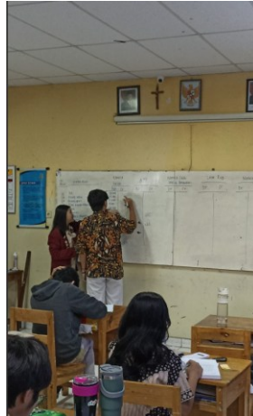
Gambar 4. Situasi dan Kondisi Kelas