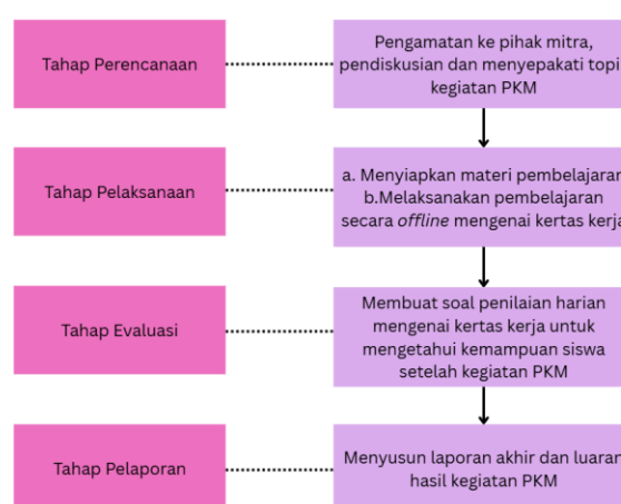
Gambar 1. Tahapan Kegiatan PKM

Kegiatan PKM dilaksanakan melalui empat tahapan utama, yaitu sesi pembelajaran, diskusi, latihan soal, dan ujian harian kepada pihak mitra. Kegiatan ini diikuti oleh 25 siswa kelas 12-2 SMA Providentia Jakarta Barat dan berlangsung selama empat kali pertemuan. Sebelum pelaksanaan pembelajaran, siswa belum mendapatkan pelajaran terkait kertas kerja. Sesi pembelajaran pertama dilaksanakan untuk memperkenalkan pengertian kertas kerja, ciri-ciri, jenis-jenis, serta cara pengisian kertas kerja 10 kolom secara rinci.