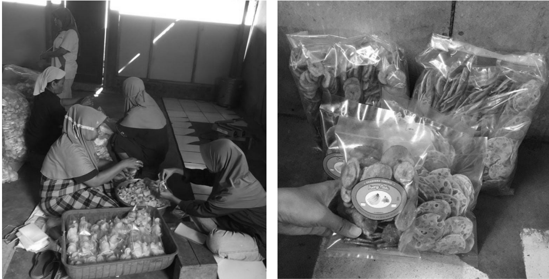
Gambar 1. Kegiatan Pengabdian dan Foto Produk

Pengabdian kepada masyarakat dilakukan sebagai penyebarluasan ilmu pengetahuan, teknologi, dan seni. Kegiatan yang berlangsung harus mampu memberikan dampak perubahan terhadap masyarakat sebagai nilai unggul dari pengabdian baik dari segi ekonomi, kebijakan, dan perubahan perilaku (sosial). UMKM keripik di Dk. Tanjung, Buaran, Kec. Bantarkawung biasa memproduksi berbagai macam jenis keripik yaitu keripik singkong, keripik pisang madu dan keripik tempe sagu, seperti tampak pada Gambar 1. Keripik-keripik tersebut biasa dipasarkan secara langsung pada pasar di berbagai daerah seperti Bangbayang, pasar Buaran, pasar Tonjong. Selain dipasarkan langsung oleh sang pemilik usaha, UMKM keripik tersebut juga bekerja sama dengan beberapa toko lain untuk turut serta menjualkan keripik-keripik hasil produksinya.