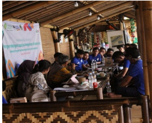
Gambar 3. Pelatihan kepemimpinan

kepemimpinan komunitas, agar dapat mengelola pariwisata berbasis komunitas secara lebih efektif dan berkelanjutan. Sebanyak 40 peserta mengikuti pelatihan ini, dan mereka diberikan materi mengenai strategi keberlanjutan, pengelolaan limbah, serta kepemimpinan transformasional yang dapat meningkatkan partisipasi anggota komunitas. Hal ini sejalan dengan Peraturan Wali Kota Bekasi Nomor 22 Tahun 2018 tentang Pengelolaan Pariwisata Berbasis Masyarakat, yang mendukung pengembangan destinasi wisata secara partisipatif.