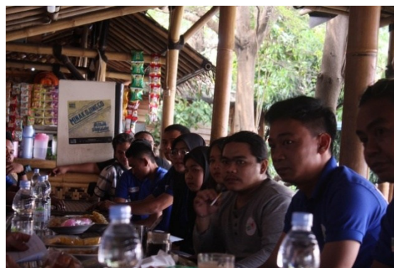
Gambar 2. Pertemuan dengan pengurus Komunitas Pengelola Wisata Situ Rawa Gede

Berdasarkan hal tersebut, kegiatan sosialisasi dilaksanakan pada tanggal 10 Agustus 2025, yang bertujuan untuk memberikan pemahaman dasar mengenai kepemimpinan dalam konteks pariwisata berbasis komunitas dan keberlanjutan. Sosialisasi diikuti oleh 40 peserta yang terdiri dari pengurus komunitas dan tokoh masyarakat. Pada sesi ini, materi disampaikan secara interaktif, termasuk penjelasan mengenai kepemimpinan berbasis komunitas dan pengelolaan pariwisata yang ramah lingkungan, sebagaimana diamanatkan dalam Undang-Undang Nomor 10 Tahun 2009 tentang Kepariwisata, yang menekankan pentingnya pariwisata sebagai penggerak pembangunan ekonomi yang inklusif dan berkelanjutan.